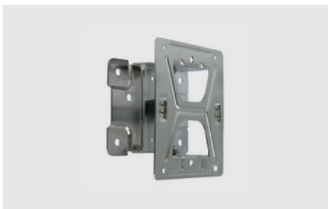
Inox AISI 304. Orientable 80°