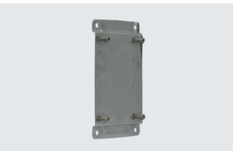
En option. Montage simplifié. Inox