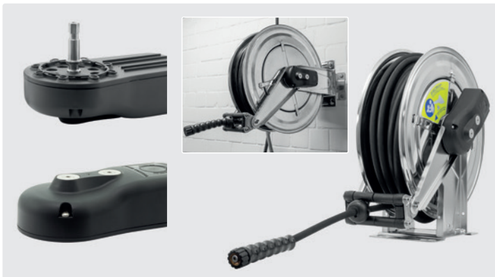
Pour les modèles R+M 434, R+M 532, R+M 534, R+M 544 and R+M 564