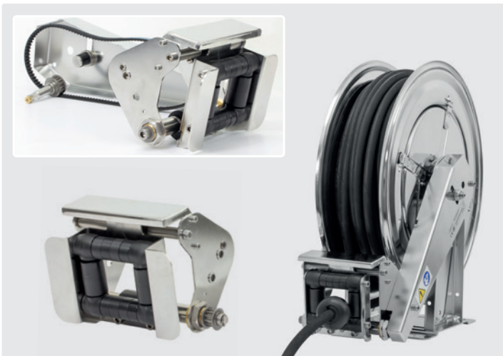
Pour les modèles R+M 434, R+M 532, R+M 534, R+M 544 (1/2" / 1") et R+M 564